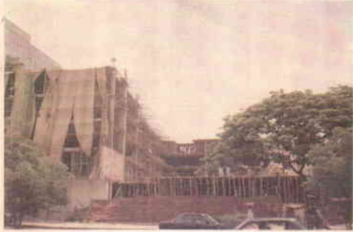
قانون جي بالادستيءَ جو پٿرو مذاق

عربي سمنڊ جي ڪناري وارو ڪلفٽن جو علائقو هندستان جي ورهاڱي کان اڳ به هڪ پوش رهائشي علائقو ۽ ڪراچيءَ جو هڪ مقبول تفريح گاه هو. هڪ سؤ فوٽ ويڪرو روڊ، باٺ آئي لينڊ، فريئر ٽائون ڪوارٽرز کي ڪلفٽن پل جي ڀرسان (پراڻي) ڪلفٽن ڪوارٽرز ايريا سان ملائي ٿو، جيڪو ٻن ٽوارن کان اڳتي آهي. ڪراچي شهر ۾ جيئن جيئن