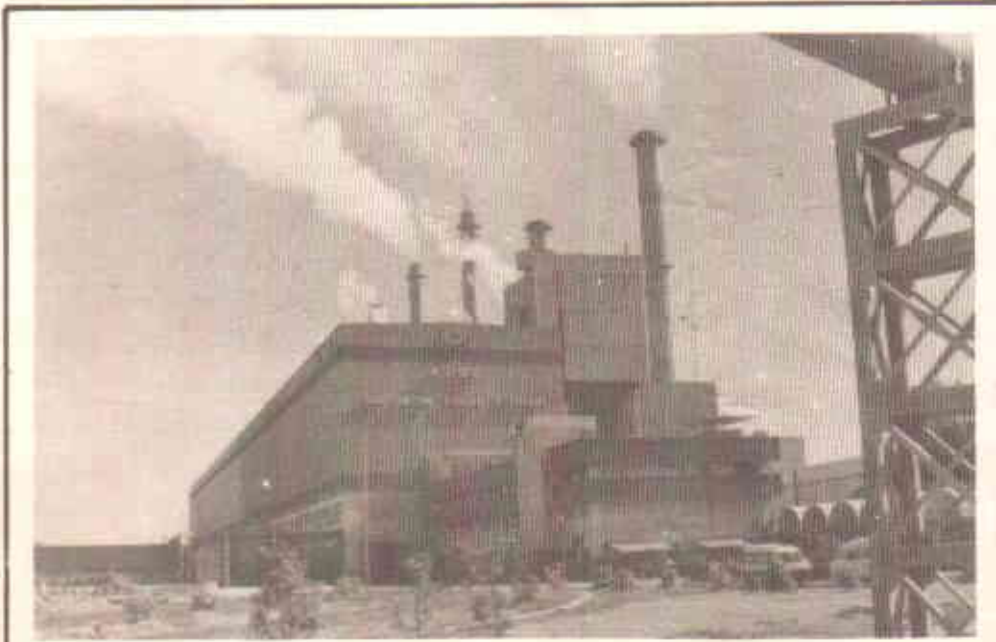
بن قاسم پر کے ای ایس سی کے پاور پلانٹ سے اٹھنے والی آلودگی

آخر میں یہ بتانے کی ضرورت ہے کہ ماحول کی وکالت بھی، انسانی، اقلیت حقوق کی وکالت یا اخبارات کے لئے کام کرنے والوں کی طرح ایڈووکیسی کرنے والے کو حقیقی خطرات سے دوچار کر سکتی ہے۔ ماحولیاتی انحطاط سے بہت دولت کمائی جاتی ہے اور اس ذریعے کو ختم کرنے کے لئے بہت طاقتور گروپوں سے مقابلہ کرنا ہوتا ہے۔ ظاہر ہے کہ کوئی بھی فرد یا این جی او ایسی صورت حال نہیں پیدا کرنا چاہتی جس میں انسانی زندگیوں کو خطرہ ہو، لیکن مفاد پرستوں کو سخت پیغام دینے کے لئے ایسے بھی حالات ہوتے ہیں جہاں حقیقی محاذ آرائی ہوتی ہے، اگر کوئی شری گروپ اس خطرناک صورت حال کا مقابلہ کر کے جیت جاتا ہے تو اس کا مطلب یہ ہوتا ہے کہ اس نے بارہا ہوا حادثہ پھر جیت لیا ہے اور یہ اس کیونٹی کی حقیقی فتح ہوتی ہے۔ □