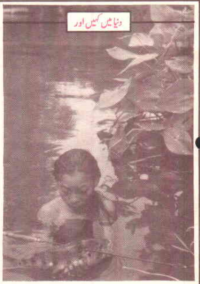
دنیا میں کہیں اور

گریو کبھی ہیں ”ابھی تک ہم نے کسی کمپنی کو یہ کہتے ہوئے نہیں سنا“ ”ہاں“ ہم یہ کریں گے