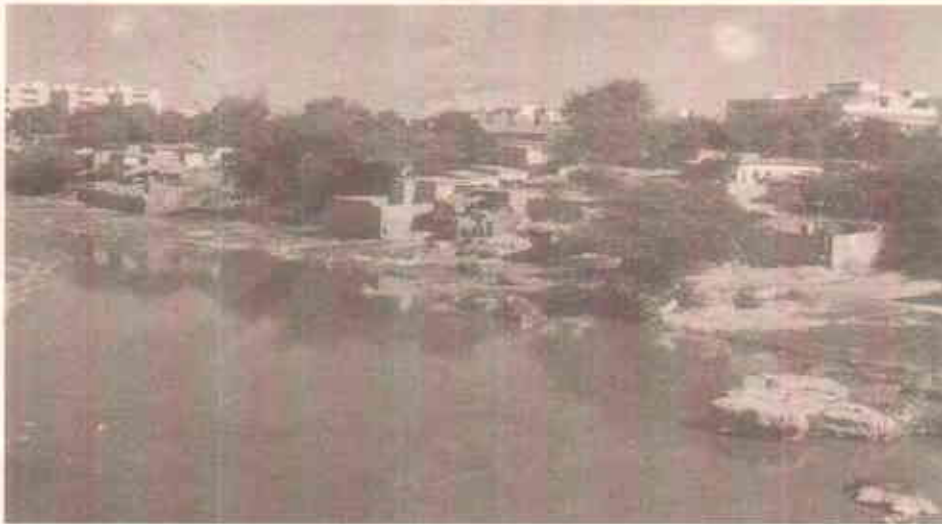
لیاری ندی کے کنارے آبادیاں

لیاری ندی کے پانی میں شامل ٹھوس مواد، بندرگاہ کے علاقے میں مٹی اور کیچڑ جمع ہو جانے کا ایک بڑا سبب ہے جس کی وجہ سے بندرگاہ کی سرگرمیوں میں خلل پڑتا ہے اور جمع شدہ مٹی اور کیچڑ کو مسلسل نکالتے رہنا پڑتا ہے۔ گرد و نواح کا حیاتاتی نظام مثلاً دلدلی جنگلات اور ان پر چلنے والی بحری حیات بری طرح متاثر ہوتی ہے جس کا سبب بلا ٹریٹ منٹ میونسپل اور صنعتی