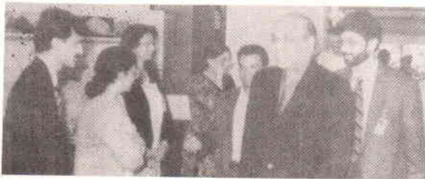
مہمان خصوصی اور شہری کے عملے کا تعارف

”شہری“ کے چیئرمین قاضی فائز عیسیٰ نے سیمینار کے اغراض و مقاصد پر روشنی ڈالتے ہوئے اس رائے کا اظہار کیا کہ ہمارے شہری حکام کی برسوں کی بدانتظامیوں کے نتیجے میں کراچی اب غالباً اس خطے کا سب سے گندہ اور غلیظ ترین شہر بن گیا ہے، انہوں نے شہری امور میں