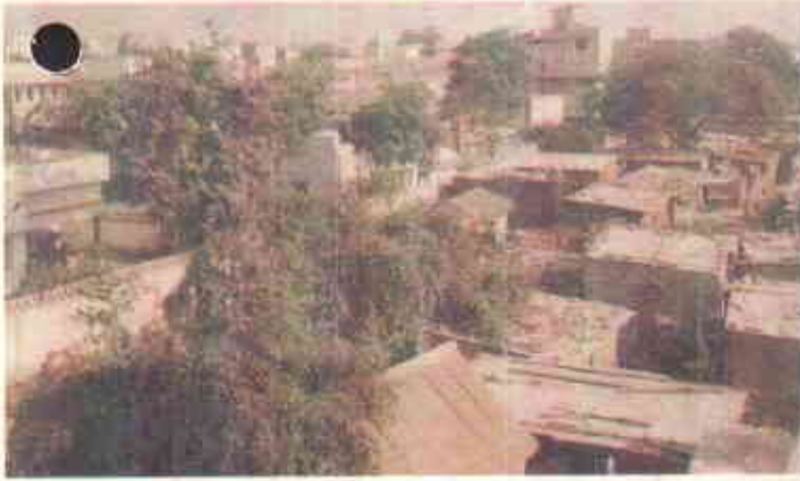
کراچی کی بنی، بگڑتی صورت