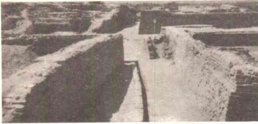
قدیم زمانے میں شہری منصوبہ بندی کی عظیم مثال

پڑتال کی فیس اور دیگر واجبات ادا کرے گا۔