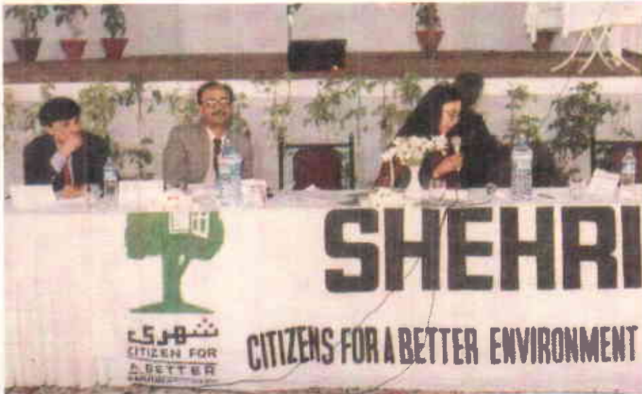
”کراچی کے بلدیاتی خدمات کے شعبے کی صورت حال“ پر شہری برائے بہتر ماحول کے زیر اہتمام ورکشاپ کا اہتمام کیا گیا۔

کسی بھی ایسی حکومت کی جو عوام کے مسائل حل کرنے کی خواہاں ہو، پالیسی کے بنیادی مقصد فطری طور پر سماجی بہبود، بنیادی سہولتوں کی ترقی اور قدرتی وسائل کی دیکھ بھال اور ترقی ہی ہونا چاہئے۔ حکومت وقت کی یہ بنیادی ذمہ داری ہوتی ہے کہ وہ اس امر کو یقینی بنائے کہ اس کے شہریوں کو مناسب تعلیم، صحت کی دیکھ بھال اور رہائش کی سہولتیں دستیاب ہوں اور جہاں تک ممکن ہو سکے انہیں سستے داموں پینے کے صاف پانی، بجلی اور سڑکوں کی سہولتیں مہیا ہوں۔ بڑے شہری مراکز پر خصوصی توجہ دینے کی ضرورت ہوتی ہے کیونکہ وہ زیادہ پیچیدہ مسائل سے دوچار ہوتے ہیں۔ ان شہروں میں سیوریج، نکاسی آب اور ٹرانسپورٹ کے موثر اور فعال نظام کے علاوہ اہل اور عوام دوست قانون نافذ کرنے والے ادارے ہونے چاہئیں۔ تاہم بدقسمتی سے دنیا کے بڑے حصے میں حکومتیں مختلف تاریخی، اقتصادی، سماجی اور سیاسی وجوہات کی بنا پر ایک موثر اور مثبت حکومت کی فراہمی میں ناکام رہی ہیں۔ مختلف ملکوں اور خطوں میں شہریوں کو بنیادی سہولتوں کی فراہمی مختلف درجوں اور سطحوں پر اب تک ممکن نہیں ہو سکی ہے۔ ایک کمزور حکومت اور اس سے بھی زیادہ بدتر شکل میں ایک غیر فعال