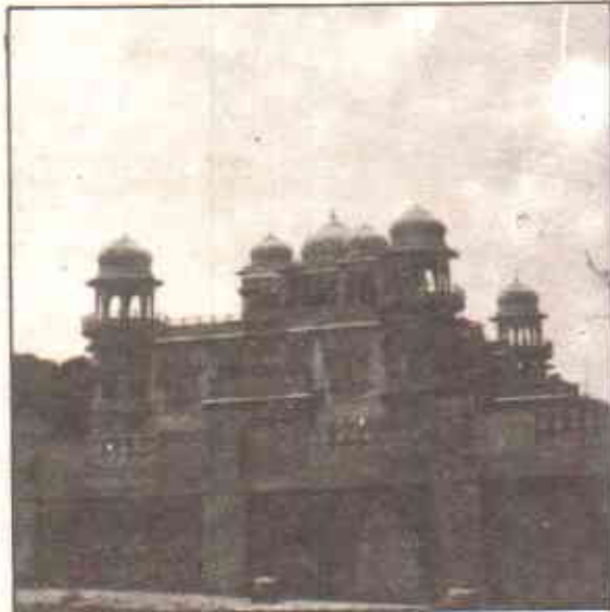
کراچی : گئے زمانوں کی باتیں

اسی طرح پریڈی، میکلوڈ، ایلفسٹن، مینسفیلڈ، بولٹن اور دوسرے لوگ ہیں