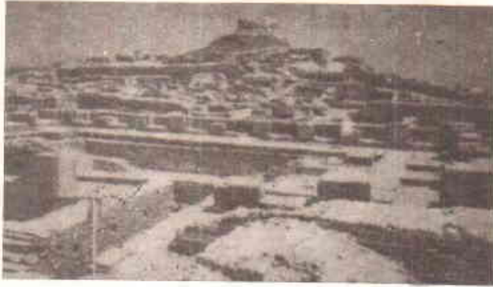
25X70 میٹر ہے۔