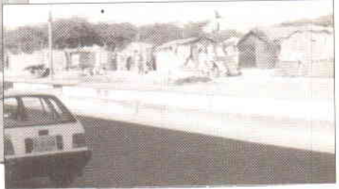
شہر میں ماحولیاتی آفات