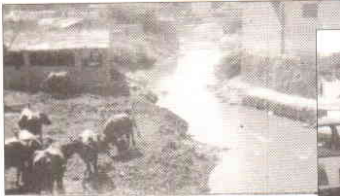
ماحولیاتی آفات کے کنارے