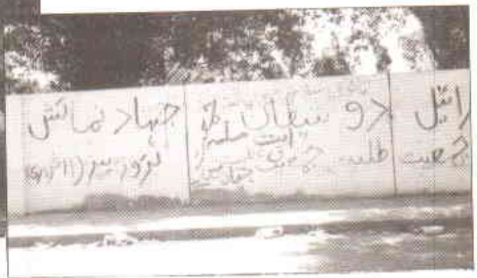
مفت کے اشتہار