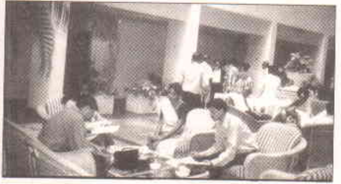
میٹری رہائش گاہ پر اجلاس میں ورکشاپ کے شرکاء