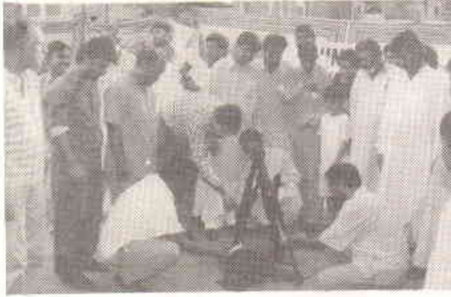
چلو، ہم آج اسلحہ کو ختم کرنے کا آغاز کریں

کے لئے کچھ کرے، کچھ عملی اقدام اٹھائے جائیں، کچھ سخت قوانین بنائے جائیں، اسلحہ کی کھلے عام نمائش پر پابندی ہو، قانون نافذ کرنے والے اداروں سے منسلک افراد اپنی گولی کو کسی انسان کو مارنے کے لئے استعمال نہ کریں، ہتھیاروں کے لائسنس کے اجراء میں حد درجہ احتیاط لازمی ہے۔ صرف اسی شخص کو اسلحہ کا لائسنس جاری کیا جائے جو اس اسلحہ کے درست استعمال سے واقفیت و صلاحیت رکھتا ہو۔ ہمارے شر میں اسلحہ تیار نہیں ہوتا اس لئے غیر قانونی ہتھیاروں کی آمد روکنے کے لئے موثر اقدامات کئے جائیں۔ ایسے قوانین اور طریقوں کو اپنایا جائے کہ ہتھیار عام لوگوں تک نہ پہنچ سکیں۔ یہ بات سمجھی جاتی ہے کہ امریکہ میں قتل کی وارداتوں کی تعداد دنیا بھر میں سب سے زیادہ ہے۔ اس کی واحد وجہ یہ ہے کہ وہاں اسلحہ با آسانی دستیاب ہے۔ ہم یقیناً ایسا ملک نہیں چاہیں گے۔ کرپشن کے معاملے میں ہمارے