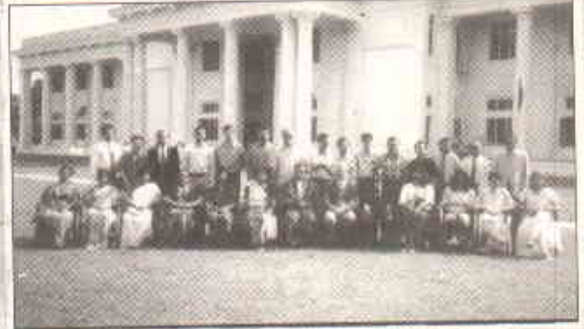
ورکشاپ کے شرکاء کولمبو کے میزبان کولمبو میونسپل کونسل کے اہلکار کے ہمراہ

اس پوری مشق کا مقصد یہ تھا کہ مختلف شہری مسائل خصوصاً "کولمبو میونسپل کونسل کے حالیہ پرائیویٹائزیشن پروگرام کے حوالے سے میز کو مشورے