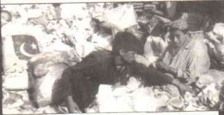
کوڑے میں روزی کی تلاش