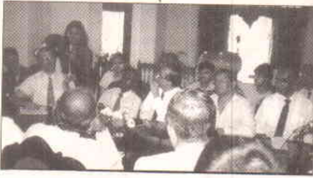
ورکشاپ کے اقتصادی اجلاس کی تیاری