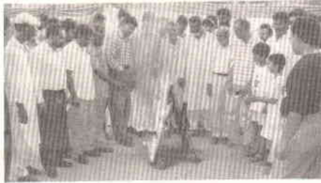
تشدد کے شعلوں کو بجھانے کے لئے اسلحہ جلانا ہوگا

بندوق مسائل کا حل نہیں ہے۔ اس کا بنیادی مقصد ہی بنی نوع انسان کو ختم کرنا ہے۔ اپنے آپ سے یہ وعدہ کریں کہ ہتھیار کا استعمال نہیں کریں گے۔ ان سے خونریزی اور تشدد و ظلم کو فروغ ملتا ہے، امن، خوشحالی اور ترقی کو نہیں۔