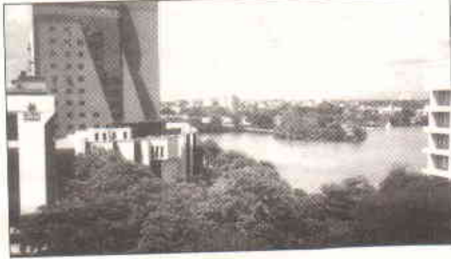
کولمبو کا ایک خوبصورت منظر

قیادت کے ہنر اور میزگی کرسی کی گرامت سے آشنا ہو جائے۔ مختلف پارٹیوں کے درمیان باہمی جھگڑوں اور سیاسی حماد آرائی کو کم کرنے کے لئے، جس کی وجہ سے خدمت کامیاب کر جاتا ہے۔ کونسل میں اپوزیشن پارٹیوں کے پانچ ارکان کو پندرہ اسٹینڈنگ کمیٹیوں کے چیئرمینوں میں شامل کیا گیا یہ سب مل کر داخل کابینہ تشکیل دیتے ہیں۔ یہ ایک نیا تصور ہے، میری کابینہ کے ۳۳ فیصد ارکان کا تعلق اپوزیشن سے ہے۔ ایک اور مثبت قدم یہ تھا کہ ہم نے انتظامیہ کو سیاست سے پاک کر دیا، کونسلز