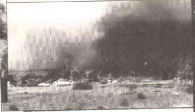
مستی فیلے کا لٹاس