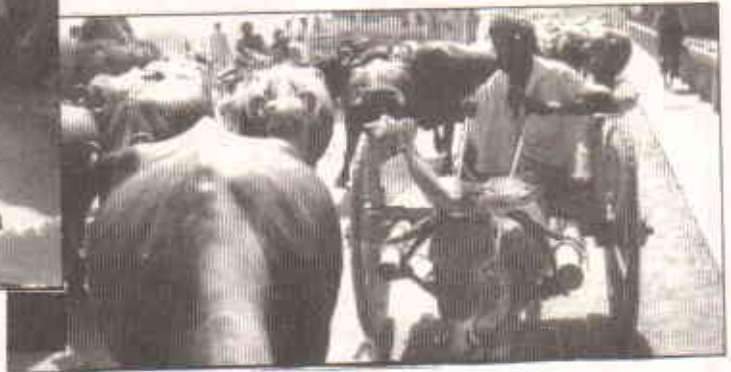
کاسمو پولیشن شہر کراچی کا ایک منظر