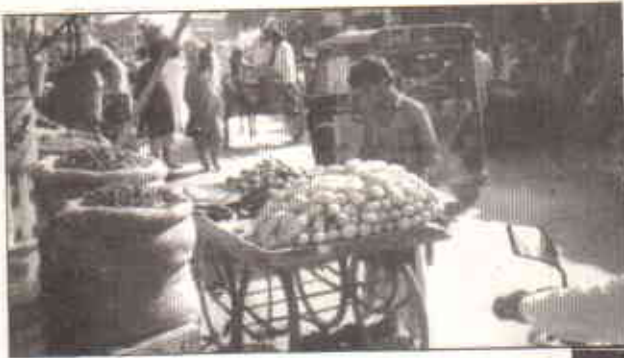
مارکیٹ کا اختتام اور سڑک کا آٹا زکماں سے ہوتا ہے؟