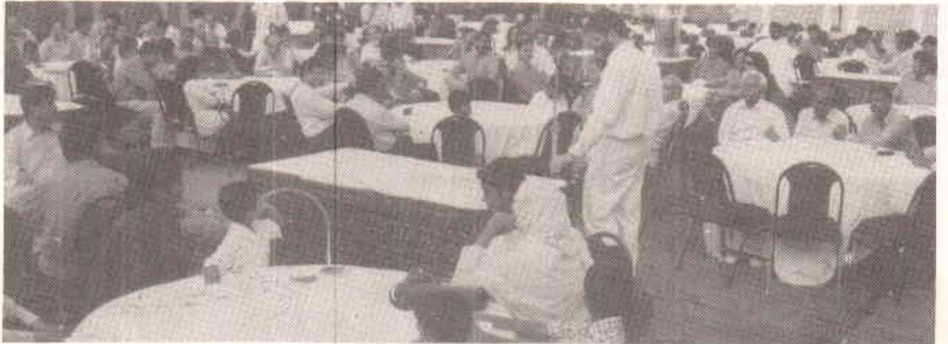
کم از کم یہ سب لوگ تو اسلحہ سے پاک معاشرے کی حمایت کرتے ہیں

انہوں نے باہمی تعاون سے اسلحہ سے پاک ماحول کے لئے ایک مہم کا آغاز کیا ہے۔ یہ تنظیمیں کیونکہ غیر سیاسی ہیں اور تشدد پر یقین نہیں رکھتیں اس لئے انہوں نے مختلف سیاسی و مذہبی جماعتوں کا طرز عمل کر کے شہر کی مصروف ترین سڑکوں اور راہوں پر جلسہ کر کے عام لوگوں کی زندگی کو مزید پریشانی میں مبتلا کرنے کی