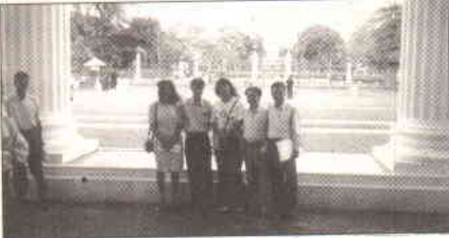
شرکاء کولمبو شہری سیاحت کے لئے تیار ہیں