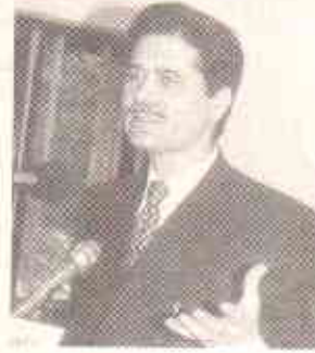
جنرل (ر) سید نور حسین نقوی چیئر پرسن این آر بی