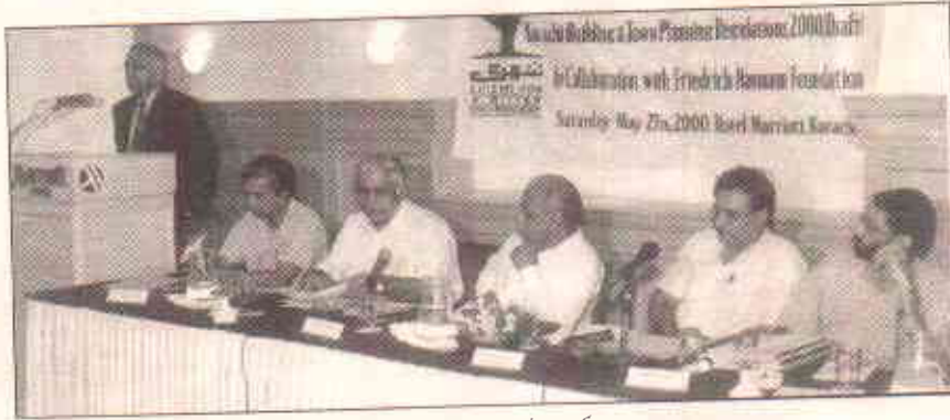
مذاکرے کے مہمان مقررین

○ منصوبہ بندی کرنے والوں کو اہم کردار دیا گیا لیکن انہیں اپنے ادا کئے گئے کردار کا ذمہ دار بھی ٹھہرایا گیا۔ ان ماہرین کو اپنی ذمہ داریوں سے بھاگنا نہیں چاہئے۔