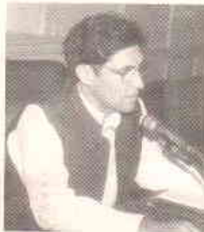
دقانی وزیر جناب عمر اصغر خان