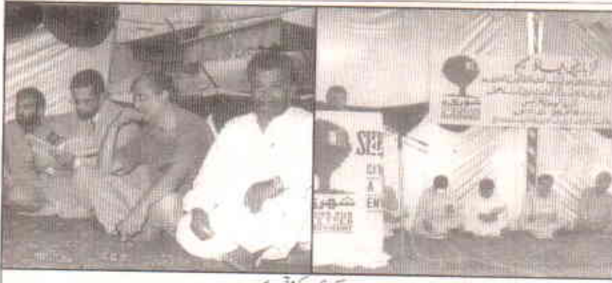
سیمینار کے مقررین

گزشتہ سال شاہ لطیف لاہوری میں ایک کانفرنس میں تقریر کرتے ہوئے مقررین نے کراچی شہر میں نیشنل پارک کی تعمیر میں تاخیر پر اپنے شدید خدشات کا اظہار کیا تھا۔ واضح رہے کہ اس کا اعلان صدر مملکت جنرل پرویز مشرف نے کیا تھا۔ نیشنل پارک گٹرباغیچہ کے مقام پر اس کے 1649 ایکڑ رقبے پر تعمیر کیا جانا تھا۔ مقررین نے اس بات کا بھی مطالبہ کیا تھا کہ پروجیکٹ کے مقام پر ہر قسم کی تجاوزات کو ختم کیا جائے اور ساتھ ہی اراضی کی تمام غیر قانونی الاٹمنٹ منسوخ کی جائیں۔