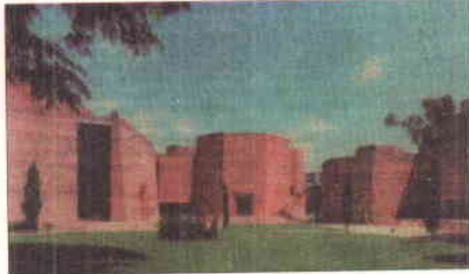
الحرم۔ جدید اور روایتی فن تعمیر کا حسین امتزاج

پاکستانی فن تعمیرات کی شناخت کو صرف 57 سال قدیم ہے تاہم اپنے سماجی اور ثقافتی ورثے کے حوالے سے اس کا تعمیراتی ورثہ سینکڑوں برسوں پر محیط ہے۔ پاکستان وادی سندھ کی تہذیب کا مسکن ہے جس پر مسلمانوں، یونانیوں، بدھوں اور ہندوؤں کے تہذیبی اثرات کی چھاپ نمایاں نظر آتی ہے۔ کسی بھی ملک کے سماجی و ثقافتی وجود میں پچاس برس کی مدت ایک غیر اہم حیثیت کی حامل ہے کیونکہ کسی بھی ملک کے فن تعمیرات کی شناخت بنانے کے لیے نسبتاً ایک طویل عرصہ درکار ہوتا ہے۔