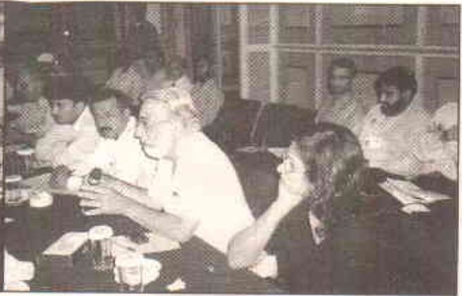
سیمنار میں شریک مقررین اظہار خیال کر رہے ہیں