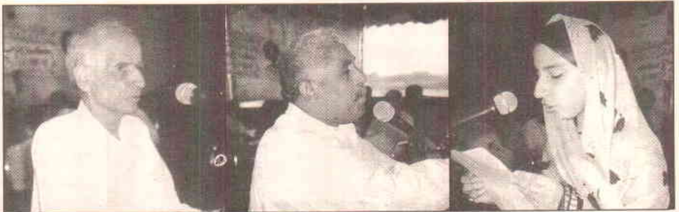
سیمنار میں شریک مقررین خطاب فرما رہے ہیں

باقی رہ گئی ہے۔ مقررین نے حکومت سندھ اور مقامی حکومت پر زور دے کر کہا کہ انہیں نیشنل پارک کے منصوبے کو صدر کی 28 اپریل کی تقریر کے مطابق انجام دینا ہوگا۔ انہوں نے کہا کہ ان علاقوں کے باشندوں کو ترقی کے عمل سے حاصل ہونے والے فائدوں سے ہمیشہ محروم رکھا گیا ہے اور یہ لوگ جدید سہولتیں میسر نہ آنے سے تکلیف کے دن گزار رہے ہیں۔ یہ کانفرنس بلوچ رائٹس کونسل کراچی نے شہری کے تعاون سے بلائی تھی۔ بلوچ رائٹس کونسل ایک این جی او ہے جو