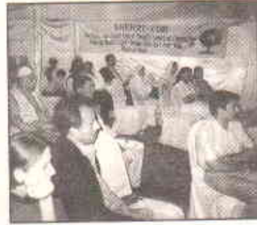
شہریوں کے ساتھ تبادلہ خیال

رکھے کے لیے ان کے حوالے سے لوگوں میں آگاہی پیدا کرنا۔