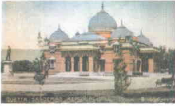
سنڈین ہال، جو ۱۹۳۵ء کے زلزلے میں مسمار ہو گیا تھا

سرگرم علاقے میں واقع ہے جہاں گزشتہ 60 برسوں کے دوران متعدد تباہ کن زلزلے آچکے ہیں، سب سے زیادہ تباہ کن 1935ء کا زلزلہ تھا جس کے نتیجے میں کوئٹہ شہر تقریباً "مکمل طور پر تباہ ہو گیا تھا۔ 1935ء کے بعد اس بات کو محسوس کیا گیا کہ آئندہ شہر کی تعمیرات اس انداز کی ہونی چاہئیں کہ وہ زلزلے کے جھکوں کو برداشت کر سکیں۔