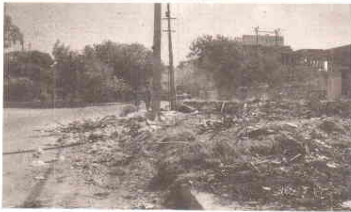
ہمارے شہر کا ایک عام منظر

کے ایم سی کی داخلی تنظیم بہت کمزور ہے، ادارے میں بڑی تعداد میں غیر مندرجہ الراد سبسی پتھروں پر اہل ترقی کر لئے گئے ہیں