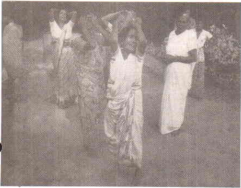
جائزہ میں اپنے پیاروں کی موت پر فوج کتنا عورتیں

جائے کہ اختلاف سے اتفاق تک کا فاصلہ طے کرنے میں مدد مل سکے۔ ہندوستان میں آندھرا پردیش کے طبقاتی مسائل۔ پاکستان کے شانتی گھر میں تباہ ہونے والے گھر، بنگلہ دیش میں سیاسی اہلکار اور فوج کے ہاتھوں پریشان ہو کر برمایا ہندوستان کی سرحد پار کرنے والے مہاجرین۔ نیپال میں لسانی اور طبقاتی مسائل بہتر طور پر سمجھ میں آنے لگتے ہیں۔