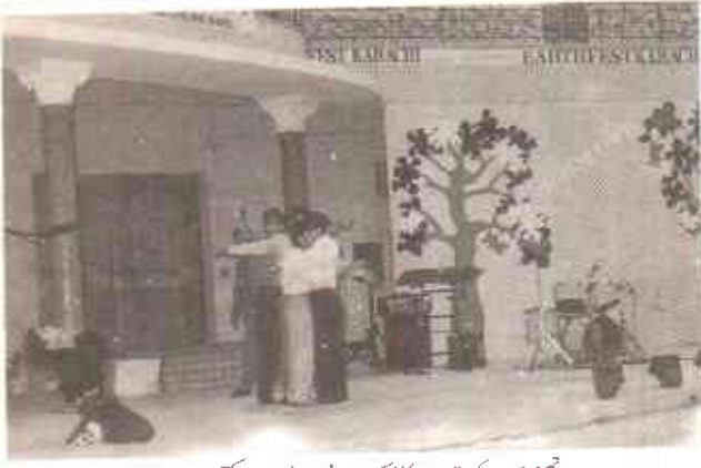
تھیٹر بچوں کی تربیت کا ایک موثر وسیلہ بن سکتا ہے

توجہ دیتے ہیں جن سے ہمارا آج کا شہری معاشرہ دوچار ہے۔