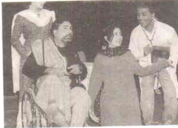
اچھا تھیٹر اثر چھوڑتا ہے

زبان میں گریس کا مطلب دماغ لڑانا یا ذہنی مشق ہے۔ یہ کھیل بچوں کے بارے میں