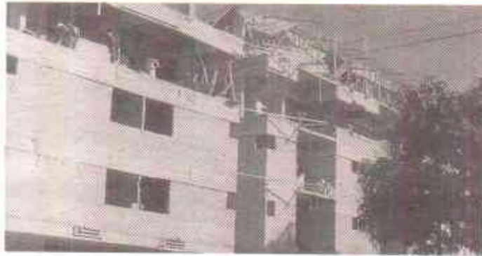
قواعد و ضوابط کی خلاف ورزی کا منظر

بدقسمتی سے اس ماسٹر پلان ۲۰۰۰ء پر اب تک بہت سا وقت اور لاکھوں ڈالر ضائع ہو چکے ہیں لیکن اس کا کوئی فائدہ