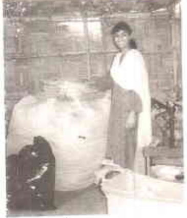
رضیہ اپنے کام سے خوش ہیں