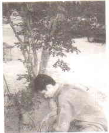
ٹھنڈی مٹھی کھاد کا استعمال

اصولاً ہونا تو یہ چاہئے کہ اس کچرے کا انتظام بلدیاتی ادارے کریں۔ کراچی میں کے ایم سی (کراچی میٹرو پولیٹن کارپوریشن) ٹھوس کچرے کو جمع کرنے اور ٹھکانے لگانے کی ذمہ دار ہے۔ بد قسمتی سے جیسا کہ ہم سب جانتے ہیں کے ایم سی اس سلسلے میں خدمات کا ایک