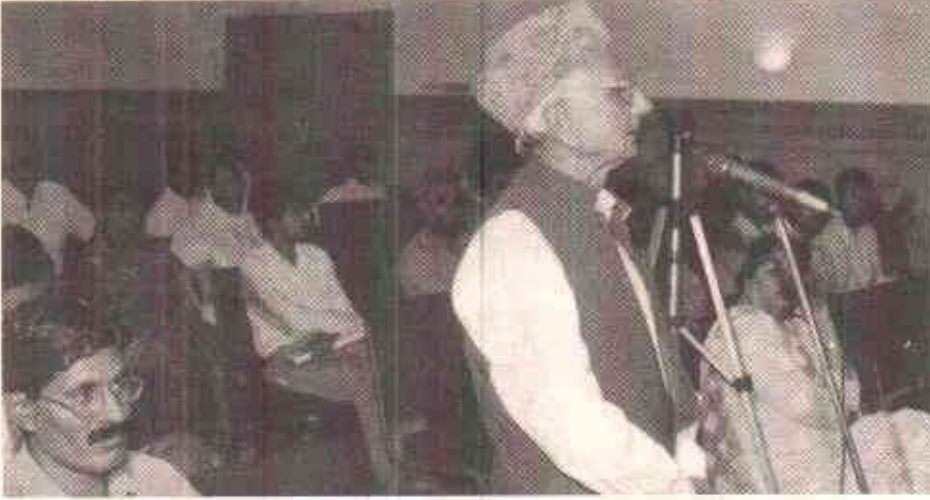
کراچی کے ایک شہری کا سوال

کے کسی بھی حصے میں اس طرح کپار ٹمنٹ نہیں ہیں۔ وہاں بھی خواتین سفر کرتی ہیں اور ڈرائیور سمیت مسافر بھی ان کا احترام کرتے ہیں۔ یہاں بھی ایسا ہی ہونا چاہئے۔ سرحد اور پنجاب میں بھی یہی ڈرائیور ہیں وہاں تو یہ بد تمیزی نہیں کرتے۔ کراچی میں آکر ان کا رویہ کیوں بدل جاتا ہے۔ اس کا جواب تو کراچی کے شہریوں کو دینا چاہئے۔ جہاں تک ٹریفک سگنل توڑنے کا سوال ہے تو جہاں سرکاری حکام اور پڑھے لکھے افراد سگنل توڑتے ہوں وہاں بس ڈرائیور تو پھر جاہل ہیں۔ ساری بات قانون کی حکمرانی کی ہے۔ سخت قوانین ہوں اور ان پر عملدرآمد بھی ہو تو بہت سے مسائل خود بخود حل ہو جائیں گے۔