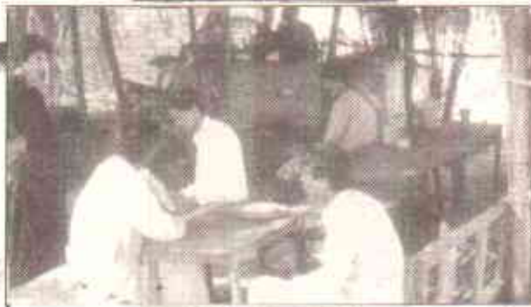
”کھوکھو“ لیب سڑک ریٹورن