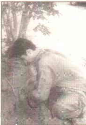
درختوں کی دیکھ بھال کریں