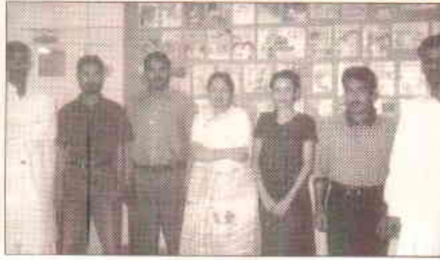
بک گروپ کی ٹیم کے ارکان

بک گروپ دہما توں اور گاؤں کے بارے میں لکھنے کا منصوبہ بنا رہا ہے۔ اس کے لئے بک گروپ کے اراکین سچا ڈیو گوٹھ گئے۔ وہاں کے کینوں سے بات کی اور تصویریں کھینچیں تاکہ وہ خود ایک سندھی گاؤں کے بارے میں معلومات حاصل کرسکیں۔ اسی طرح وہ تھر کے