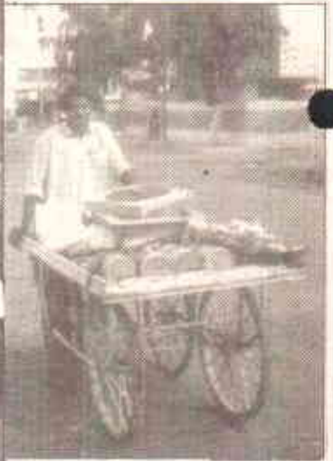
ایک شخص کی روٹی دوسرے کی روزی