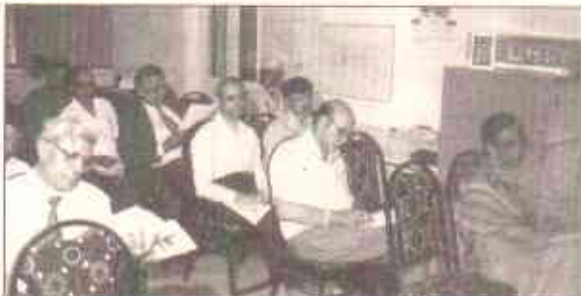
اجلاس کے حاضرین