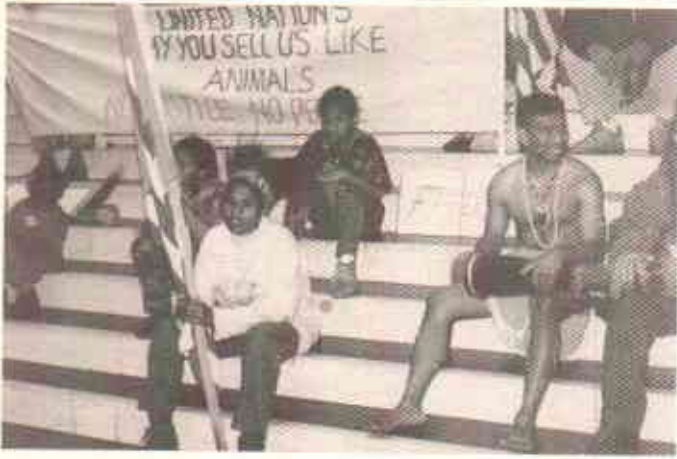
امن کے لئے مظاہرہ کا ایک انداز

مقررہ نے جنوبی دنیا کی باشندہ ہونے کی حیثیت سے یہ کہا کہ ہمارا ماحولیاتی تنوع عالمی سرسوتوں کی جائیداد نہیں۔ کوسو میں لسانی تطہیر دراصل ثقافتی یک رنگی پیدا کرنے کی خواہش کی ایک مثال ہے۔ جبکہ ایک ایسی دنیا کا تصور جہاں تمام انسان ایک جیسے ہوں، تمام پودے اور جانور ایک طرح کے ہوں کسی کے لئے قابل قبول نہیں ہوگا۔ ہماری کوشش ہے کہ ہم اپنے ہاں کے تمام جانداروں یہاں تک کہ آخری مگزی تک کا تحفظ کر کے اپنا ماحولیاتی تنوع اور فطری نظام کو برقرار رکھیں۔ ہمیں نہ صرف اسلحہ اور نیوکلیئر سے پاک خطے چاہئیں بلکہ جرٹوموں کی صنعت گرمی سے آزاد علاقے مطلوب ہیں۔ ہمارے لئے یہی امن کے معنی ہیں جہاں ہم اپنے ثقافتی تنوع کا جشن مناسکیں اور اپنی غذا پیدا کرنے کے لئے اپنی زمین میں مقامی بیج بوسکیں۔