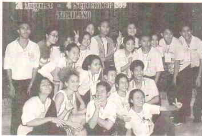
این جی او سمپوزیم میں شریک ہونے والے نوجوان

نوجوانوں کو اہمیت دی جائے۔ ان کے لئے اہم مواقع کے دوران خصوصی گفتگو کی جائے۔ انہیں یہ موقع دیا جائے کہ وہ اظہار خیال کر سکیں۔ ان میں جرات اظہار پیدا ہو۔ یہ فیصلہ کسی بھی سطح پر ہوا قابل تحریف ہے۔