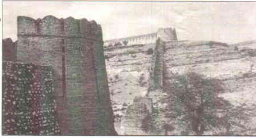
مشہور قلعہ رانی کوٹ