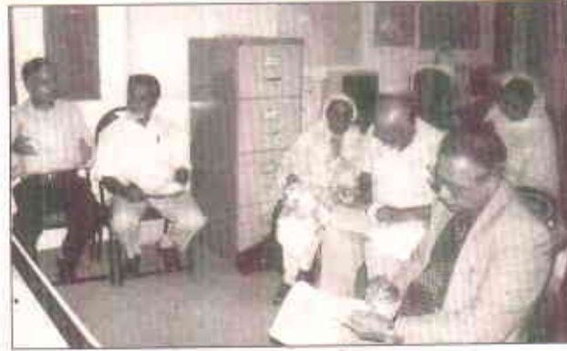
اراکین کا انہماک