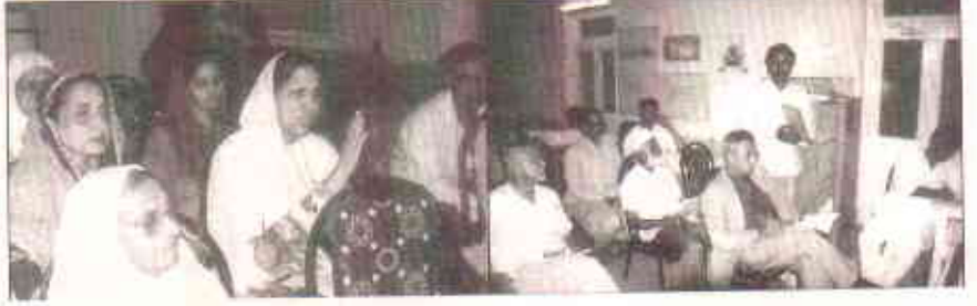
اجلاس کی کارروائی میں بھرپور شرکت کا انداز