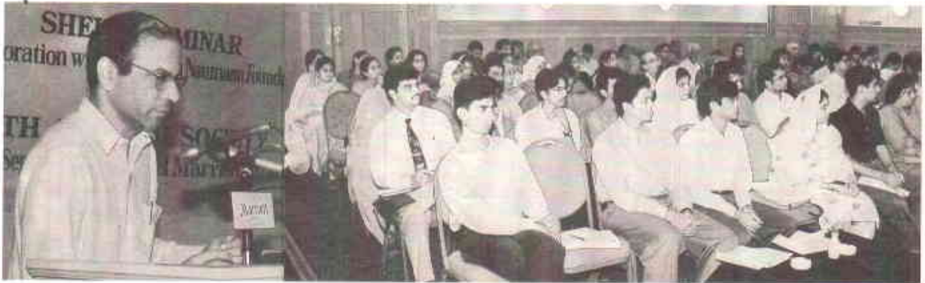
تیسری بجائی خطاب کر رہے ہیں