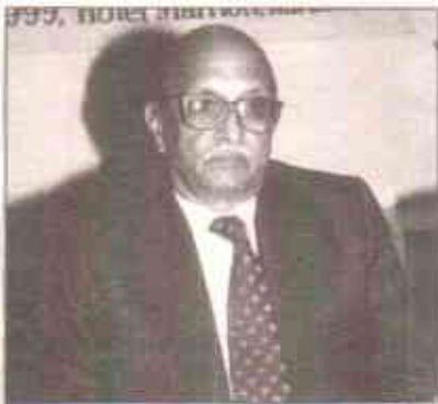
جسٹس سلیم اختر