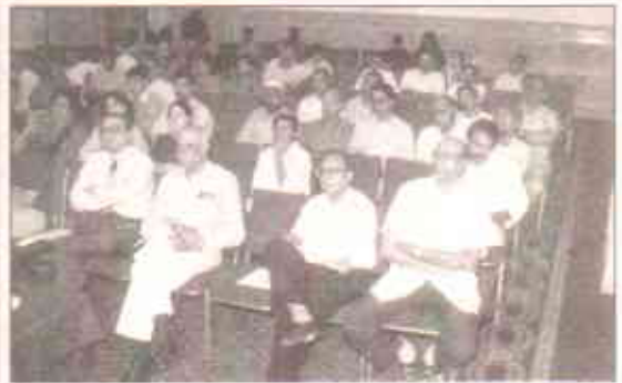
مذکرے کے شرکاء