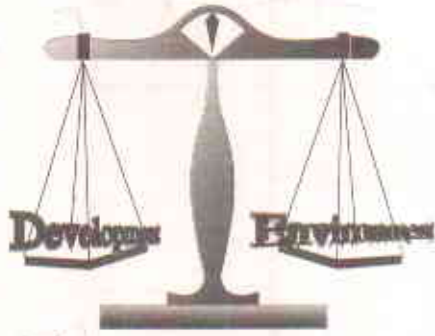
Balancing the scales