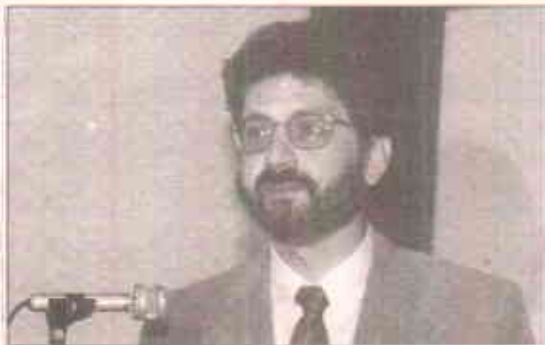
قاضی فائز عیسیٰ

چنانچہ ایک ورکشاپ کا اہتمام کیا گیا تاکہ سپریم کورٹ کے مذکورہ فیصلوں اور دیگر متعلقہ فیصلوں کے بارے میں