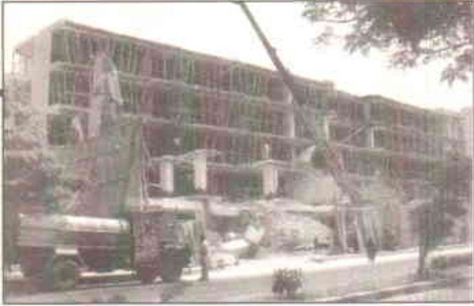
سارکے ہوئے گلاس ٹاورز