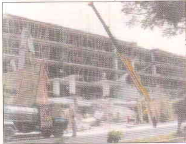
گلاس ہاور: غیر قانونی تعمیرات کا انہدام

لاچھی بلڈرز مافیا اور حکومت میں ان کے سر پرستوں نے باضابطگی و باقاعدگی کے بارے میں لاتعداد مغالطہ آمیز دلائل اور باطل نظریات تخلیق کئے ہیں۔ ان باطل نظریات کو عوامی ہمدردی حاصل کرنے اور عوام کے