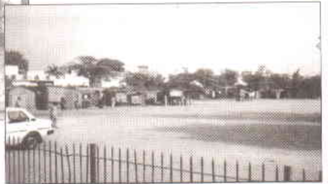
ایک پارک میں تجاوزات