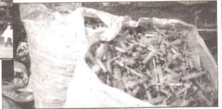
اپتالوں کے فضلہ کو ٹھکانے لگانے کا نامناسب طریقہ باعث تشریش ہے