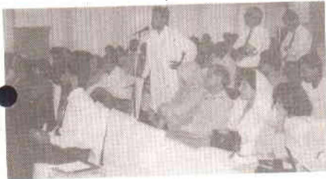
حاضرین کے سوالات کی تقاریر