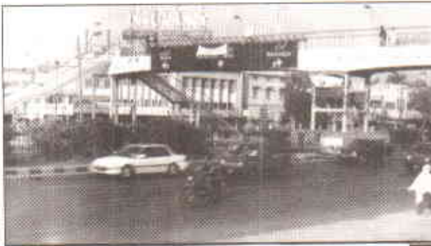
پیدل سڑک پار کرنے کے لئے بنائے گئے پل زیادہ مفید ثابت نہیں ہوئے