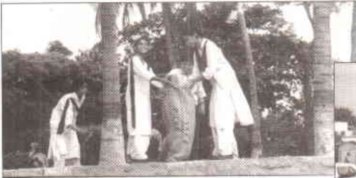
ہماری نئی نسل میں ماحولیاتی شعور بڑھ رہا ہے