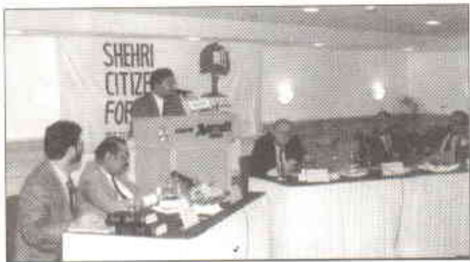
شہری کے سیمینار کے شرکاء