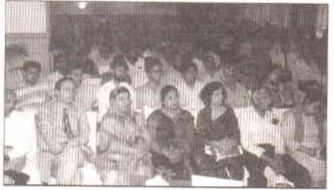
سینار کے شرکاء

ترمیم کا مطالبہ کیا اور انہیں ذمینی حقائق سے متعلق بنانے پر زور دیا، انہوں نے کہا کہ سیاسی اثر و رسوخ کے ذریعے قوانین کو جھکانے کا سلسلہ بند ہونا چاہئے۔