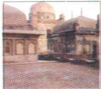
سروں کے مقبرے

جامشور واپس تعلیمی اداروں کے لئے مشہور ہے جن میں مہران یونیورسٹی آف