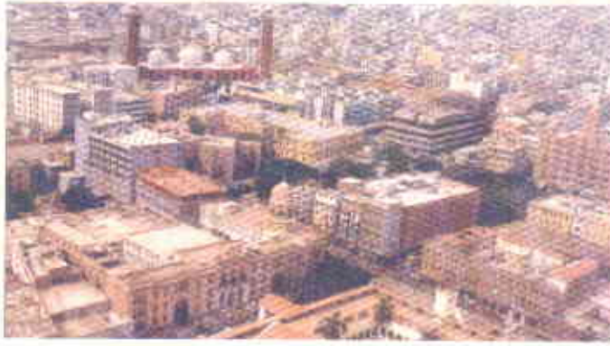
نہج آباد کراچی کا فضائی منظر

ہے۔ موخر الذکر دونوں شہروں میں تقریباً ۳۰ کلومیٹر کے دائرے میں موجود تمام شہری علاقوں کو شامل کیا جانا چاہئے۔ حیدر آباد میں جام شورو، کورٹی، نیاری، ٹڈو جام وغیرہ اور سکھر میں خیرپور، روہڑی و شکارپور وغیرہ شامل ہوں گے۔