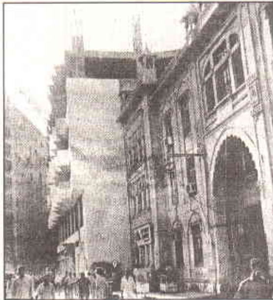
قانون شکنی کی ایک مثال

کے تحت تعمیرات کے کام میں مصروف ہیں۔ یہ بہت اثر و رسوخ کے مالک ہیں اور بہت سی غیر قانونی عمارات کی تعمیر کرچکے ہیں یا کرنے میں مصروف ہیں‘