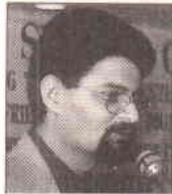
ملا انشیل موڈرننگ کر رہے ہیں

قاضی فائز عیسیٰ نے ایک دلچسپ مسئلے کو اٹھایا جب انہوں نے یہ کہا کہ پاکستان میں تمام قوانین اور رپورٹیں انگریزی میں دستیاب ہیں لیکن ایک فرد