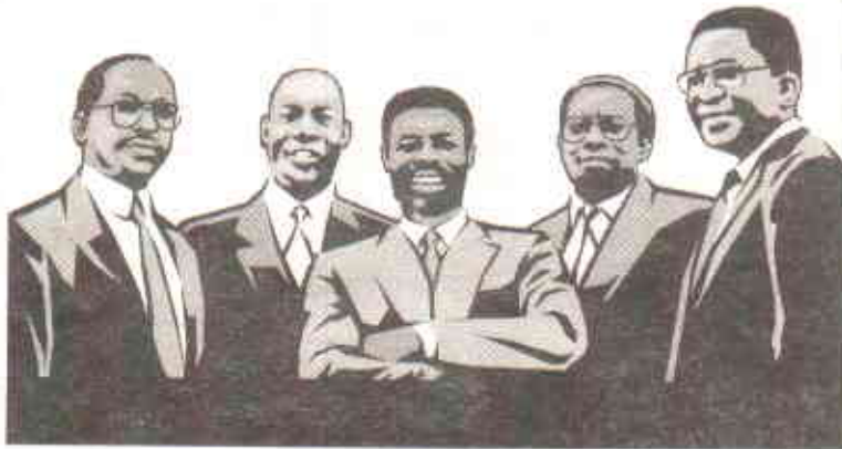
میئر کا لوگوں کے درمیان لیڈر ہونا ضروری ہے

سے کچھ شاید شمالی کیرولینا کے ایک میئر کا مقابلہ بعض دوسری ریاستوں کے مختلف شہروں کے میئر سے کر سکتے ہیں جو ایک حقیقی ایگزیکٹو دفتر میں براہجان ہوتا ہے ( واضح طور پر شمال کے بڑے شہر کے میئر) دوسرے اسے صرف ایک علاقہ سربراہ قرار دے سکتے ہیں، شمالی کیرولینا کے نان ایگزیکٹو میئر کے بارے میں عام طور پر یہ سمجھا جاتا ہے کہ انہیں جتنا کرنا چاہئے وہ اتنا کام کرتے نہیں ہیں۔ یا انہیں زیادہ اختیارات ملنے چاہئیں تاکہ