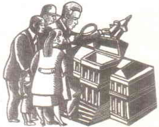
دفتر محتسب اعلیٰ عوامی مفادات کی نمونہ داشت کرتا ہے

سپریم کورٹ آف پاکستان کے فیصلے کے مطابق ایک فیصلہ خود ہو کہ وہی کے ذریعے حاصل کیا جائے وہ قانون کی نگاہ میں معدوم ہے