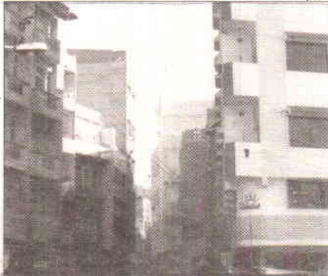
کیا ہمارے شہری منصوبہ ساز کراچی کی اس صورت سے مطمئن ہیں